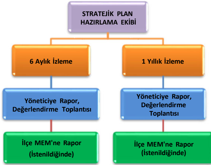
Şekil 3: İzleme ve Değerlendirme Süreci

Müdürlüğümüzün 2024-2028 Stratejik Planı İzleme ve Değerlendirme sürecini ifade eden İzleme ve Değerlendirme Modeli hazırlanmıştır. Müdürlüğümüzün Stratejik Plan İzleme- Değerlendirme çalışmaları eğitim-öğretim yılı çalışma takvimi de dikkate alınarak 6 aylık ve 1 yıllık sürelerde gerçekleştirilecektir. 6 aylık sürelerde rapor hazırlanacak ve değerlendirme toplantısı düzenlenecektir. İzleme-değerlendirme raporu, istenildiğinde İlçe Milli Eğitim Müdürlüğü'ne gönderilecektir. Ayrıca ilçemizin Mülki İdari Amirine sunulacaktır. 1 yıllık izleme-değerlendirme çalışmaları, Stratejik Planımızda yer alan hedeflerin yıllık düzeyde ifade edildiği Performans Programı ve yılsonunda gerçekleşme düzeylerinin belirlendiği Faaliyet Raporu hazırlanarak yapılacaktır.